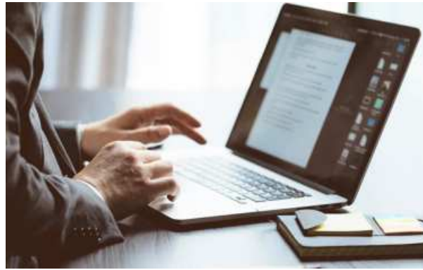
MORE TAKERS. The demand for certain companies is strong because of the nature of the work they do, say analysts